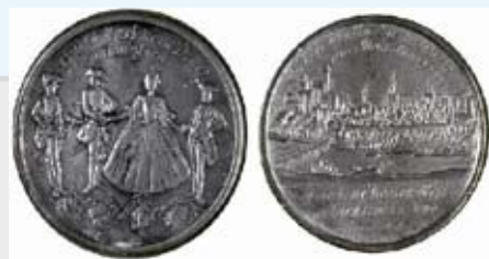
Medal upamiętniający Pokój Cieszyński

Cesarz Karol VI, w 1722 roku nadał Księstwo Cieszyńskie w lenno księciu Leopoldowi Lotaryńskiemu (1679-1729), w zamian za włoskie księstwo Monferrato. Jego syn Franciszek Stefan Lotaryński (1708-1765), przyszły cesarz Franciszek I, został w 1736 roku mężem Marii Teresy, córki Karola VI. Matężństwo to zapoczątkowało dynastię Habsbursko-Lotaryńską, a ich potomkowie rządzą Księstwem do 1918 roku. Cesarz zmarł w 1765 roku, a Księstwo Cieszyńskie, jako osobiste lenno, zapisał swemu synowi cesarzowi Józefowi II (1741-1790). Był on pierwszym z Habsburgów, który osobiście zainteresował się swymi cieszyńskimi dobrami, odwiedzając je w 1766, 1773 i 1787 roku. Z okazji ślubu siostry Józefa II, arcyksiężniczki Marii Krystyny (1742-1798)