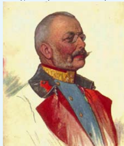
Arcyksiążę Fryderyk Albrecht (1914)

Wspomnienia wybielają przeszłość, nadają jej wielu nowych kolorów. Jaka jednak była rzeczywistość, jakie były realne związki Cieszyna z habsburską dynastią? Ukazuje to spacer szlakiem książąt cieszyńskich z dynastii habsburskiej po Cieszynie i Czeskim Cieszynie.